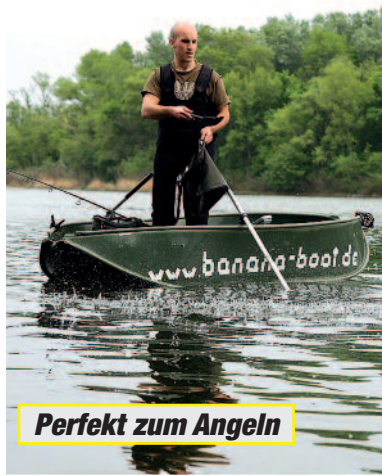
Perfekt zum Angeln