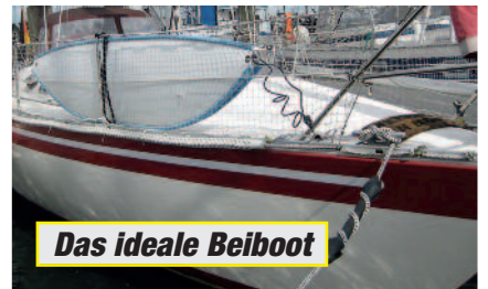
Das ideale Beiboot