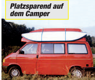
Platzsparend auf dem Camper