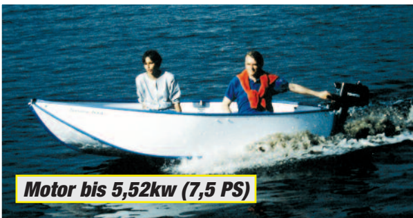
Motor bis 5,52kw (7,5 PS)